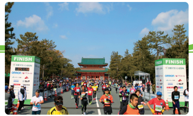
平安神宮 Heian-jingu Shrine