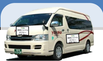
↑ シャトルタクシーのイメージ ※9人乗りジャンボタクシー

◆ 京都マラソン（平成27年2月15日(日)）開催中は、 交通規制等に伴い運休、経路変更する路線バスの代替手段として、 下記の経路・時間において、無料シャトルタクシーを運行いたします。