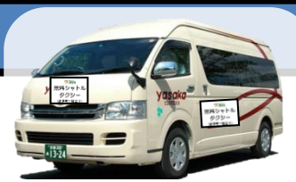
↑ シャトルタクシーのイメージ ※9人乗りジャンボタクシー

◆ 京都マラソン（平成27年2月15日(日)）開催中は、 交通規制等に伴い運休、経路変更する路線バスの代替手段として、 下記の経路・時間において、無料シャトルタクシーを運行いたします。