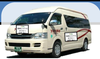
↑ シャトルタクシーのイメージ ※9人乗りジャンボタクシー

◆ 京都マラソン（平成27年2月15日(日)）開催中は、 交通規制等に伴い運休、経路変更する路線バスの代替手段として、 下記の経路・時間において、無料シャトルタクシーを運行いたします。