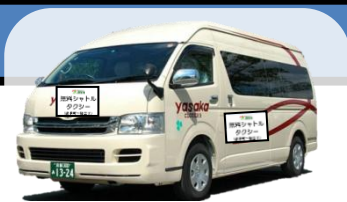
↑ シャトルタクシーのイメージ ※9人乗りジャンボタクシー

◆ 京都マラソン（平成27年2月15日(日)）開催中は、 交通規制等に伴い運休、経路変更する路線バスの代替手段として、 下記の経路・時間において、無料シャトルタクシーを運行いたします。